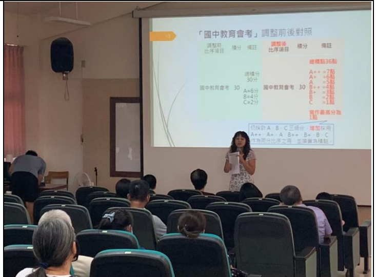
說明：說明國中教育會考計分方式