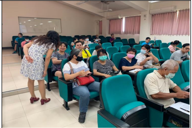
說明：校長與家長之間的近距離互動