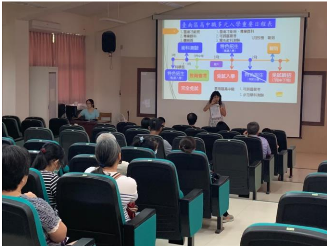
說明：說明12年國教發展未來發展