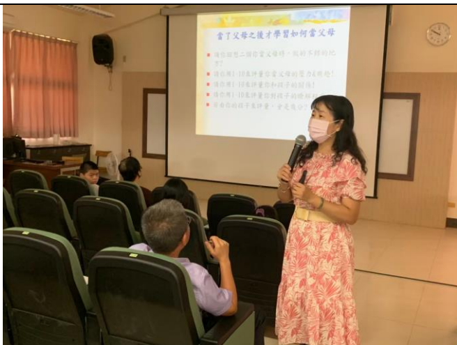
說明：協助家長了解網路成癮與管教的關係