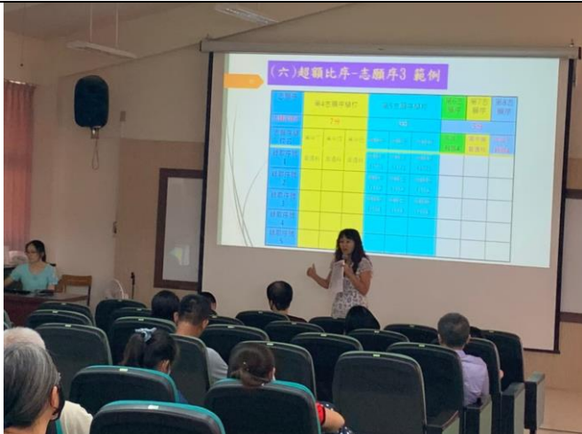
說明：說明志願選填超額比序